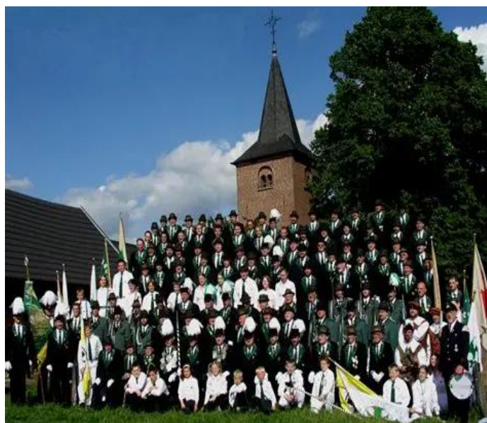
Foto aus dem Festjahr

Am Montag feiert die St. Hubertus-Gilde ihr Patronatsfest. Die Feier beginnt mit der Festmesse um 15.15 Uhr in der Hubertuskapelle. Die Messfeier für die Verstorbenen der Hubertus-Gilde ist Dienstag um 20 Uhr in der Hubertuskapelle.