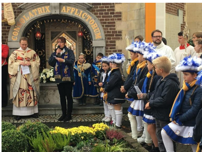
Karnevalisten Gebet vor der Gnadenkapelle

Vor Beginn der neuen Karnevalssession findet wieder die Karnevalisten-Wallfahrt statt. Die Karnevalisten feiern die heilige Messe am Sonntag, 9. November, um 11.45 Uhr in der Basilika. Die Gemeindevorlesung um 11.45 Uhr entfällt an diesem Tag.