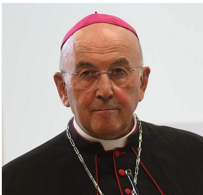
† Dr. Felix Genn Bischof von Münster

Spenden für Renovabis können direkt auf das Konto des Renovabis e.V. bei der Bank für Kirchen und Caritas eG, IBAN DE 94 4726 0307 0000 009400, BIC: GENODEM1BKC überwiesen wer- den.