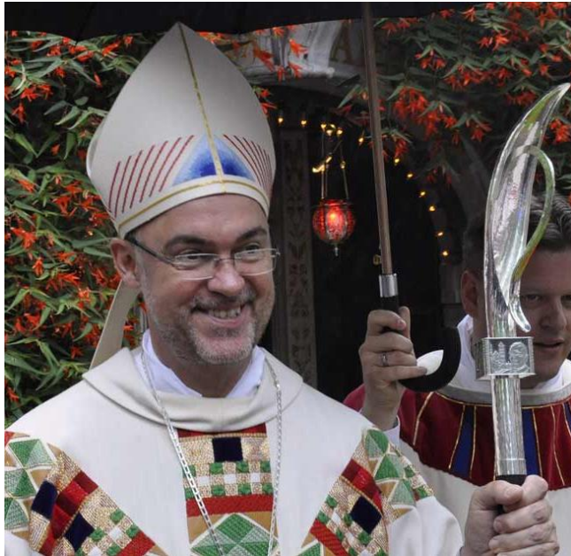
Weihbischof Rolf Lohmann

Zur Mitfeier des Pontifikalamts mit dem Weihbischof von Münster, S. Exz. Rolf Lohmann, am Sonntag, 18. Oktober, um 10.00 Uhr laden wir in die Basilika ein.